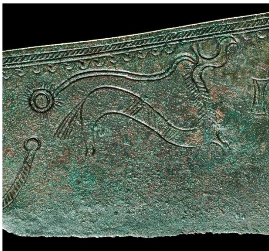
Ragekniv fra Neder Hvolris ved Viborg

Bortset fra på Bornholm findes der ikke så mange bronzealderhelleristninger i Danmark. Til gengæld har vi fantastiske fund af genstande fra bronzealderen, og her vil jeg benytte chancen for at fortælle om to berømte danske fund, som forestiller heste, der trækker solen på himlen.