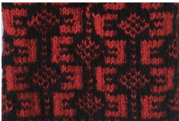
Solheste på min version af mønsteret på de gamle lettiske vanter