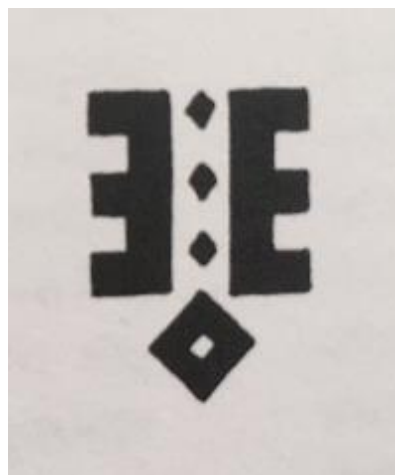
I bogen Latvian mittens betegnes symbolet Usins (Upitis, 1997). Om navnet refererer til hele symbolet eller kun de to heste er lidt uklart.

Jeg gav mig til at bladre lidt rundt i mine bøger for at se, om der var skrevet mere om mønsteret. Mange af de gamle mønstre har rejst imellem landene og er blevet lokalt tilpassede. Udtrykket ændres i forhold til materialerne, -om der skal udsmykkes i træ, broderes eller strikkes, og selvfølgelig, efter hvad der til enhver tid er moderne. Igennem historien kan mønstre ændre betydning. Folketroens symboler og fortællinger får nye betydninger som med symbolet Irmensol , der kan symbolisere Yggdrasil i nordisk mytologi og Livstræet i Bibelske fortællinger (Sundbø, 2005). I bogen Norske vanter fra Selbu hedder Irmensol-mønsteret vædderhorn og får dermed en ny betydning (Bårdsgård, 2020) (se også kap. 1 i denne fortælling).