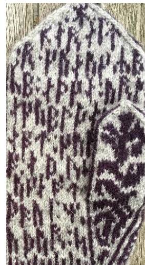
Håndfladens mønster. Runerne hopper og danser

Her opstod et strikketeknisk problem. Vanten er strikket med to farver, og der skiftes hele tiden mellem farverne for at danne mønsteret. Hvis runerne skal stå på linjer, vil der blive lange ensfarvede passager i mønsteret. Resultatet vil være lange tråde på bagsiden, som fingrene kan hænge i. Min løsning blev at lade runerne hoppe lidt på linjerne, så jeg fik en jævn fordeling af de to farver i mønsteret. Det var den praktiske forklaring. Æstetisk kom det også til at fungere bedre; Ved første øjekast ses et fladedækkende mønster, men kigger man nærmere, kan man tyde skriften. Jeg kan godt lide, at der er noget at gå på opdagelse i.