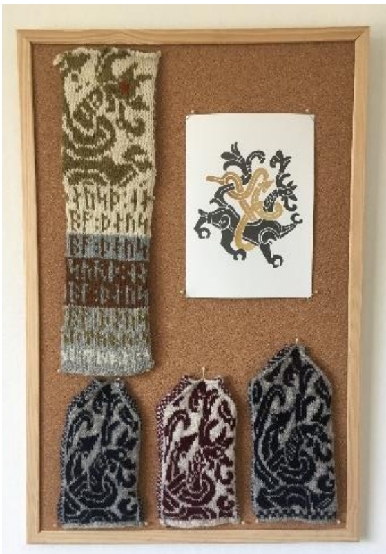
Opslagstavle med nogle af de strikkeprøver jeg lavede før brikkerne faldt på plads til diagrammet til Jellingvanterne.

Det mest spændende var at udvælge motiverne og selve designprocessen. Ret hurtigt kunne jeg se, at der ingen chance var for at få proppet hele motivet med løven og Midgårdsormen ind på vanten, så jeg måtte udvælge dele af motivet. Efter at have prøvet diverse smarte digitale metoder endte det med, at jeg satte ternet papir op på PC-skærmen og lavede en grov skitse af motivet med blyant.