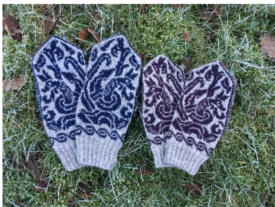
Jellingvanter. Damestørrelse strikket på pind 2mm og herrestørrelse på pind 2,5mm

Mange, der laver håndarbejde oplever en dejlig form for fordybelse, hvor tankerne vandrer, og man slapper af. Når man tager det gamle håndarbejde frem mindes man den situation, man var i og den gode radioudsendelse man måske hørte. Andre gange skal man virkelig holde tungen lige i munden og må koncentrere sig fuldt ud om teknikken og mønstret. På en måde forener man i processen det taktile med hukommelsen og det abstrakte.