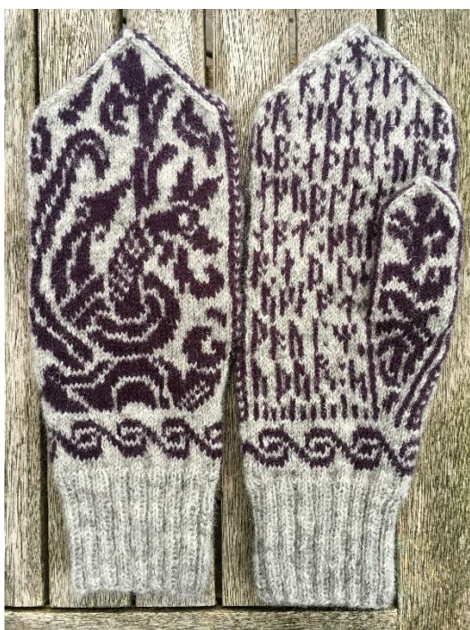
Jellingvanter med motiv fra den store Jellingsten på håndryggen

Har det noget med vanter at gøre? Nej, - men når man cykler igennem Monumentområdet hver dag, og er optaget af kulturhistorie og formidling og i øvrigt tænker på vanter, så kan det ske at, der kommer vanter ud af det.