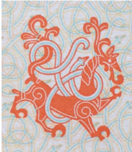
Jellingstenen. Motivet med løven og Midgårdsormen er afbildet i det danske pas