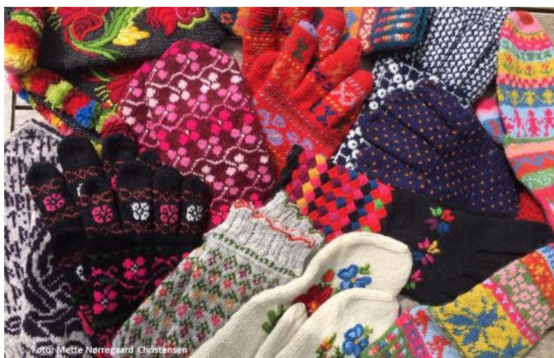
Vanteeksempler fra skuffen. Her er museumskopier af vanter fra Estland, Letland, Sverige og Finland og vanter af mit eget design i plantefarvet garn med hønsesrik og runeskrift.

Jeg har altid interesseret mig for "gamle dage", og det har fascineret mig at tænke på, hvordan det var at leve i en tid, hvor man skulle fremstille alting selv. Det er spændende at lave kopier af gammelt håndværk, især strikkede ting, fordi det er så simpelt, -en snor og to pinde -og alligevel rummer det uendelige teknikker og variationer. Jeg oplever at komme tættere på de mennesker, der levede engang, på deres levevilkår, symbolsproget og æstetikken, når jeg udforsker de gamle mønstre og traditioner.