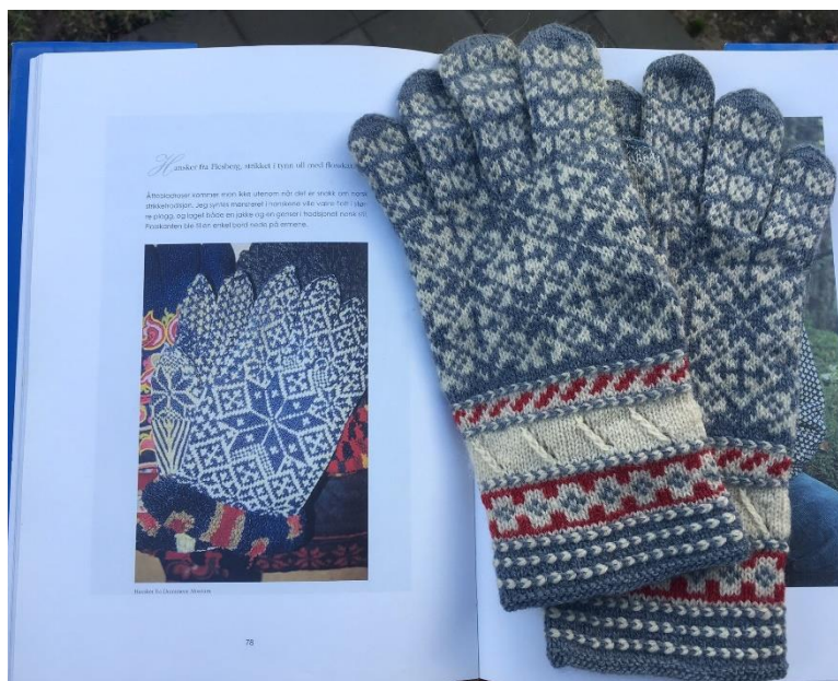
Vanterne er fra Estland og ligger ovenpå bogen "Dikt i masker. Klær du kan strikke". Vanterne fra bogen er fra museumsarkiverne i Norge

Der gik mange år før jeg fandt ud af, hvordan den hvide og blå lænkekant var strikket. Jeg regnede med at den var syet på med kædesting i to farver, men det var ikke muligt at aflure. Senere opdagede jeg, at det er en estisk vikkel . Vil man eksperimentere med at strikke de vandrette kædesting, så find en videoguide på You tube med søgeordene "vikkel" og "estonian braid".