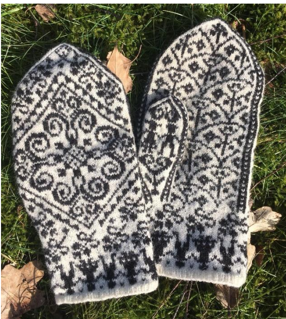
Herrevott fra "Selbustrikk".

Den "traditionelle norske vante", Selbuvanten, er historien om en bestemt type vanter knyttet til en bestemt egn i Norge. Men det er også historien om gæve kvinder, der i slutningen af 1800-tallet, skabte sig en egen økonomisk indkomst ved at strikke vanter til salg. Vanterne blev populære og efterhånden blev vantestrikning sat i system, der kom standarder for garnets tykkelse og for størrelser. I 1930'erne var strikningen en hjemmeindustri, og vanterne kunne eksporteres i stor stil (Bårdsgård 2020). Vanterne blev en del af norsk identitet, og nu er ingen i tvivl om, hvordan norske vanter ser ud og at 8-bladsstjernen er norsk.....eller.... Mon ikke der er mere til den historie?